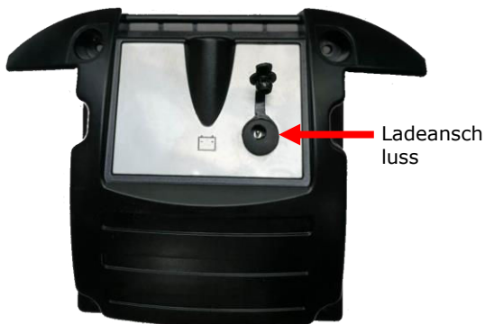
Ladegerät – Ladevorgang aktiv